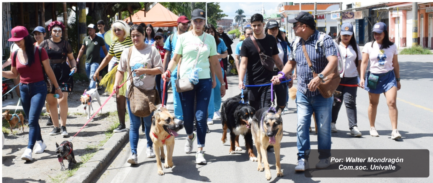
Por: Walter Mondragón Com.soc. Univalle

Una vez más Cogancevalle se lució en su Concurso Anual de Mascotas evento que se realizó en cooperación con la Cámara de Comercio, en confluencia con la 9ª Feria Agroindustrial de Tuluá, organizada por dicha entidad municipal.