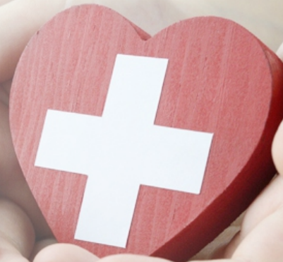
Seguro de Vida